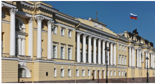
Boris Yeltsin Presidential Library Building

Президентская библиотека имени Бориса Ельцина выбирает Этере ETX в качестве обновления и в знак нового доверия к решениям Этере за их проверенную на рынке производительность, превосходное качество рабочего процесса и надежность.