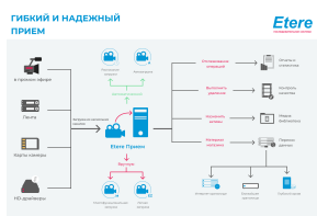
Этере Гибкий и надежный прием