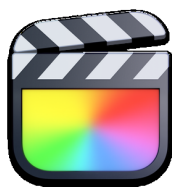
Final Cut Pro

редакторы контента могут получить доступ к профессиональному программному обеспечению для редактирования видео, цвета, эффектов и постобработки звука непосредственно из интерфейса Этере. Войдя в систему, каждый пользователь может увидеть все доступные активы и начать подключение к базе данных Этере.