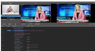
Nunzio Graphics Editor