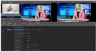
Nunzio Graphics Editor