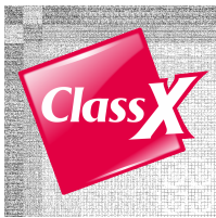
Class X Logo