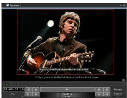
Asset Form Preview