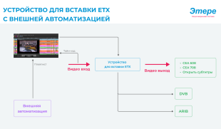
Этере ETX Inserter with External Automation