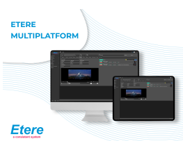
Etere Web Multiplatform