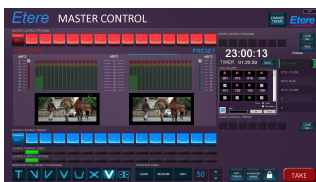
ETERE MASTER CONTROL diagram