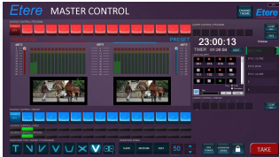
ETERE MASTER CONTROL diagram

Главное управление Этере расширяет видео- и графические функции Этере ETX для достижения новых возможностей полноценного воспроизведения на основе ИТ.