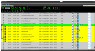
etere master control