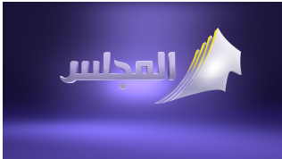
Al-Majlis TV Channel

Официальный телеканал Национального собрания Государства Кувейт расширяет возможности воспроизведения и управления медиа с помощью ETERE 31.3.