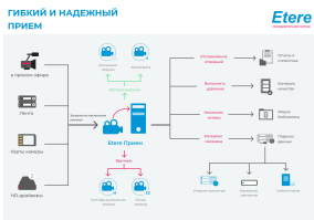
Этере Гибкий и надежный прием