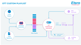
OTT Custom Playlist