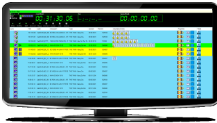
SCTE Signal on scheduling

en charge une variété d'expériences de visionnage sur les téléphones mobiles, les ordinateurs et les téléviseurs intelligents