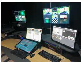
Georgian Public Broadcaster