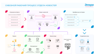
Этере Сквозной рабочий процесс отдела новостей

Этере представляет свою последнюю функцию совместимости: бесшовную интеграцию с нейрон-графикой от Brainstorm (Brainstorm Neuron Graphics). Эта система на основе MOS и шаблонов революционизирует создание графики и управление ею в отделах новостей и при работе с трафиком вещания. Теперь пользователи могут без особых усилий интегрировать высококачественную предопределенную 3D-графику в свой рабочий процесс.